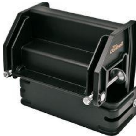
Support de bateau adaptable en option. Un support standard est fourni d'origine.

Les plantes envahissantes peuvent réduire considérablement vos activités sur l'eau. Le faucard portatif vous permettra avec un confort et une facilité d'utilisation maximum d'entretenir vos pièces d'eau.