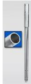
Rallonge de 60 cms