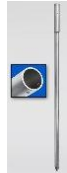
Rallonge de 120 cms